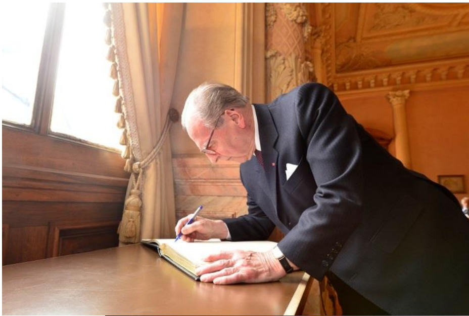
Signature du livre d'or de la ville de Chambéry par Monsieur Gabriel de Broglie, Chancelier de l'Institut de France, membre de l'Académie Française.