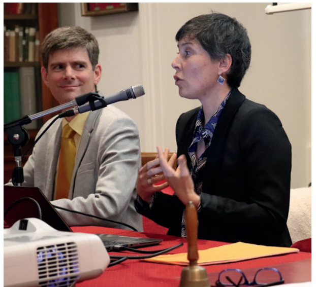
S. GOSSSELIN, M-A. GUERIN

Les fouilles qui ont permis de découvrir les cuisines épiscopales et des sépultures sous la salle capitulaire ont amélioré la connaissance de l'histoire du bâtiment. Quant aux collections, de plus de 100.000 objets, elles ont été documentées et restaurées quand nécessaire.