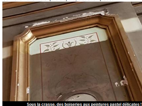
Sous la crasse, des boiseries aux peintures pastel délicates !

Dans une deuxième phase, pour laquelle l'Académie des Sciences, Belles-Lettres et Arts de Savoie, va continuer à collecter des fonds, les galeries latérales seront dégagées et la lustrerie, inspirée du Palais Garnier à Paris mais qui a disparu, d'être remplacée.