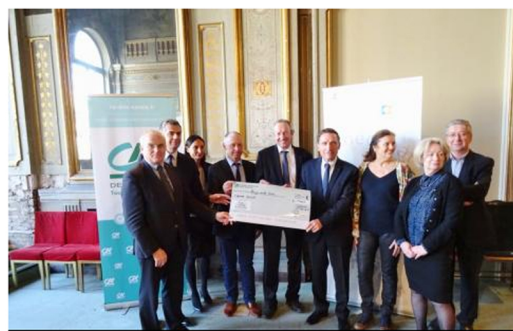
Remise officielle du chèque du Crédit Agricole des Savoie et de la Fondation Crédit Agricole Pays de France à l'Académie des Sciences, Belles Lettres et Arts de Savoie

Culture | Publié par La rédaction le Lundi, 26 Mars, 2018 - 18:50.