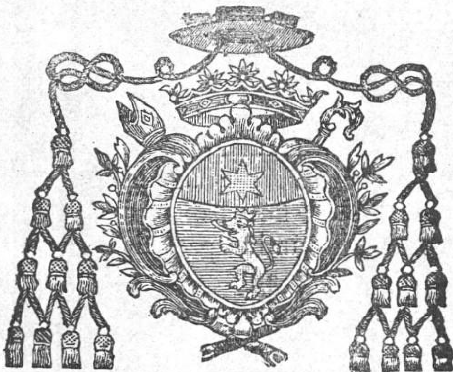
En-tête d'une « Feuille de Pouvoirs » (pour le Chanoine J.-B. de la Palme)